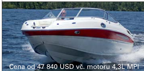
Cena od 47 840 USD vč. motoru 4,3L MPI