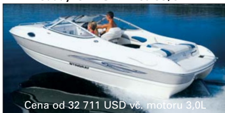
Cena od 32 711 USD vč. motoru 3,0L