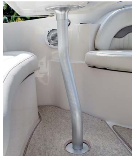
Chytře řešený je kokpitový stůl s „křivou“ nohou, která umožňuje jeho natočení do správné polohy podle rozmístění posádky.