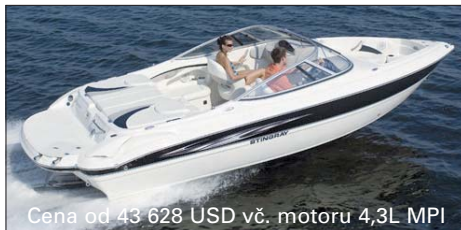
Cena od 43 628 USD vč. motoru 4,3L MPI