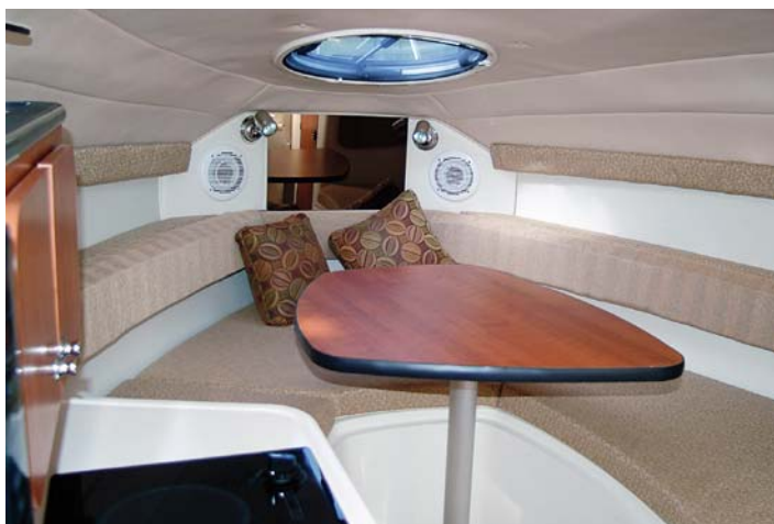
Kajuta má uspořádání obvyklé snad u všech srovnatelných modelů různých výrobců.

Americká firma Stingray je prostřednictvím firmy BoatService již řadu let zastoupena i na českém trhu. V roce 2010 navíc loděnice slaví 30 let od svého založení, a tak jsme využili nabídky testovat model 250 CS na Orlíku.