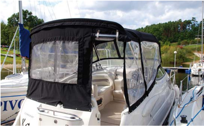
Kokpit se dá úplně zakrýt.

bylo 100 litrů benzínu, tedy asi 50 % objemu nádrže. Tento motor je totiž osvědčený, úsporný, ve srovnání s osmiválci i lehký, a proto velmi oblíbený. Problém by mohl nastat v případě, že by loď byla obsazena větší posádkou a nákladem. Budoucím majitelům by ale mělo být jasné, že na to tato loď prostě není určena, i když to teoreticky možné je.