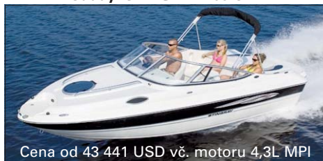
Cena od 43 441 USD vč. motoru 4,3L MPI