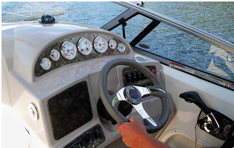
Klasická palubní deska