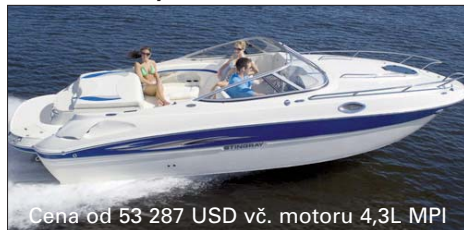
Cena od 53 287 USD vč. motoru 4,3L MPI