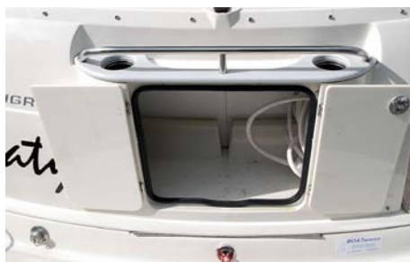
Zadní úložný prostor