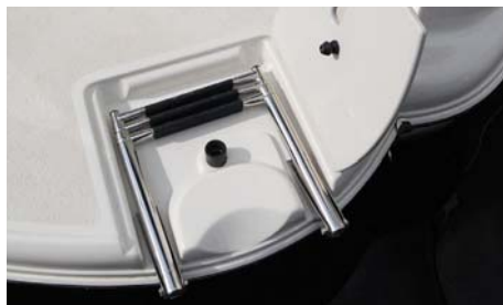
Ukrytý nerezový žebřík na koupací plošinu