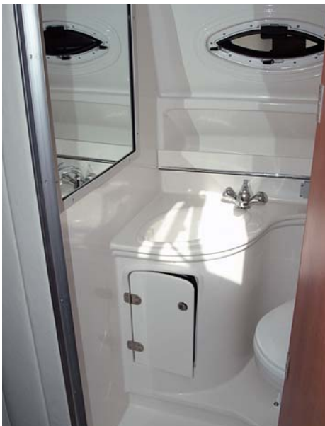
Toaleta se sprchou a umyvadlem je vpravo pod schody.