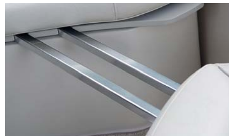
Zadní lavici a křeslo je možné důmyslným systémem přeměnit na opalovací lůžko.

chanou střechu bimini včetně prodlužovacího dílu. Dodává to zajímavý vzhled, loď rozhodně působí na vodě větší. V zatáčkách je jízda jistá, loď se chová zcela předvídatelně. Při prudkém stažení plynu se záďová vlna dostane nejdále na koupací plošinu, kokpit zůstává suchý. Směrová stabilita je při pomalé jízdě poněkud neklidná, směr je nutné občas korigovat. Nedá se nic dělat, je to loď navržena pro jízdu ve skluzu. Přestože testovaný člun byl na vodě již několik měsíců a dno bylo „narostlé“, nebyl znát úbytek výkonu.