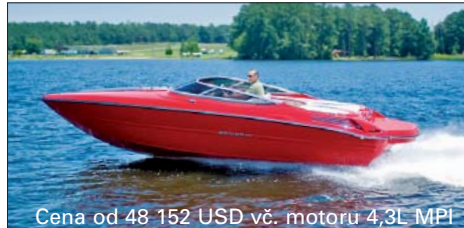
Cena od 48 152 USD vč. motoru 4,3L MPI