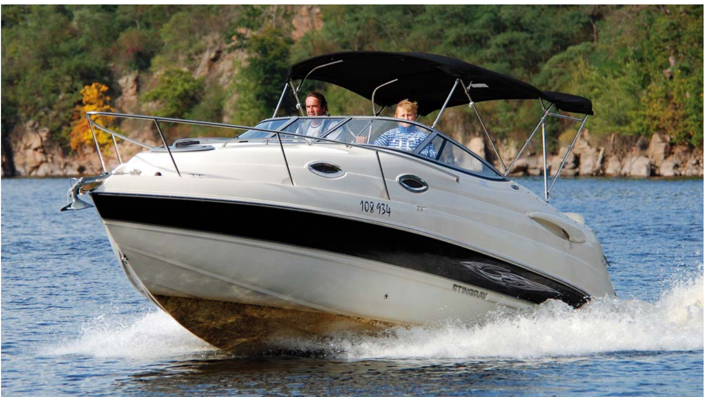
Během celého testu jsme měli ponechanou střechu bimini včetně prodlužovacího dílu.