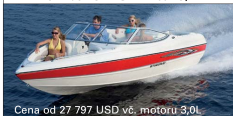
Cena od 27 797 USD vč. motoru 3,0L