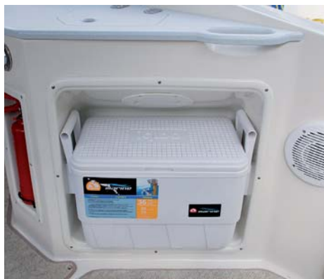
V kokpitu nechybí prostor pro přenosnou ledničku.