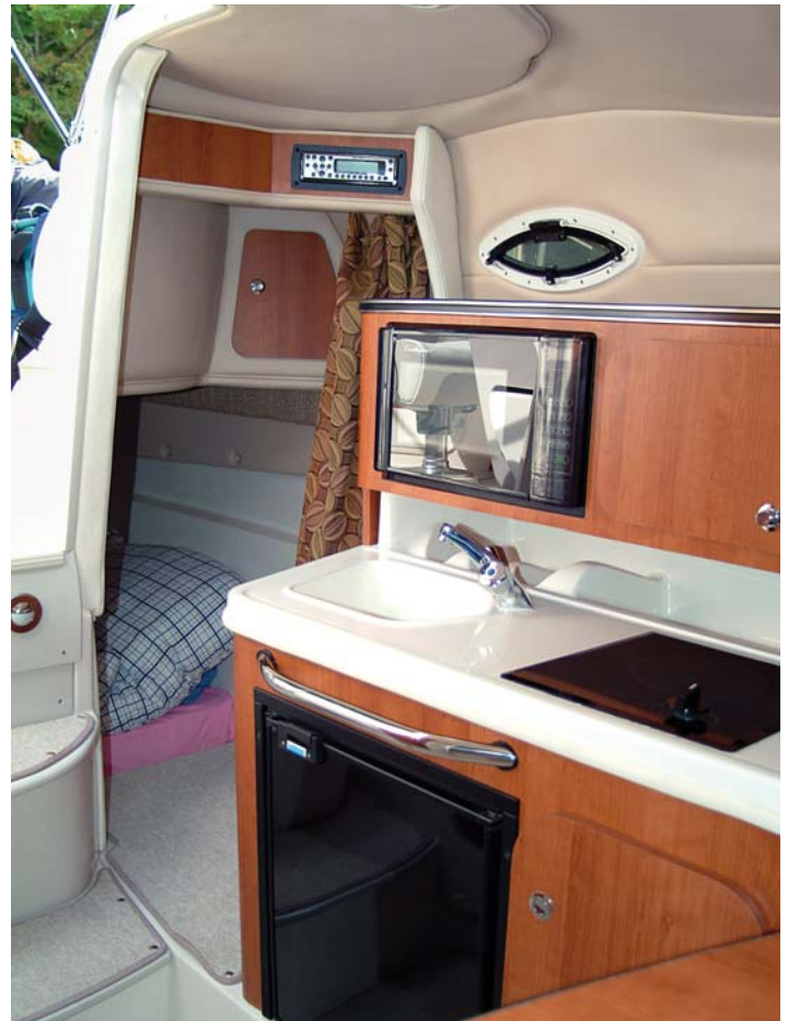
Na levé straně je klasická kuchyňská linka s mnoha úložnými prostory, vaříčem a dřezem.

Po krátkém seznámení pomalu vyplouváme na otevřenou vodu a v úseku, kde je to dovolené, rozjíždíme loď do skluzu. Přechod do skluzu je plynulý a velmi svižný. Stačí standardní práce s trimem motoru a plynovou pákou. Z místa řidiče je dobrý výhled i při rozjezdu. Během celého testu jsme měli pone-