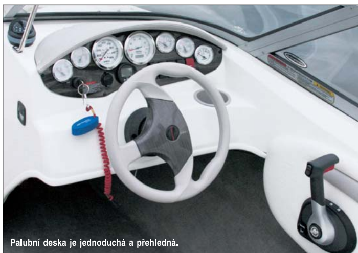
Palubní deska je jednoduchá a přehledná.