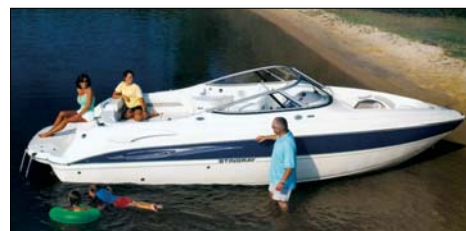
Stingray 250 LR