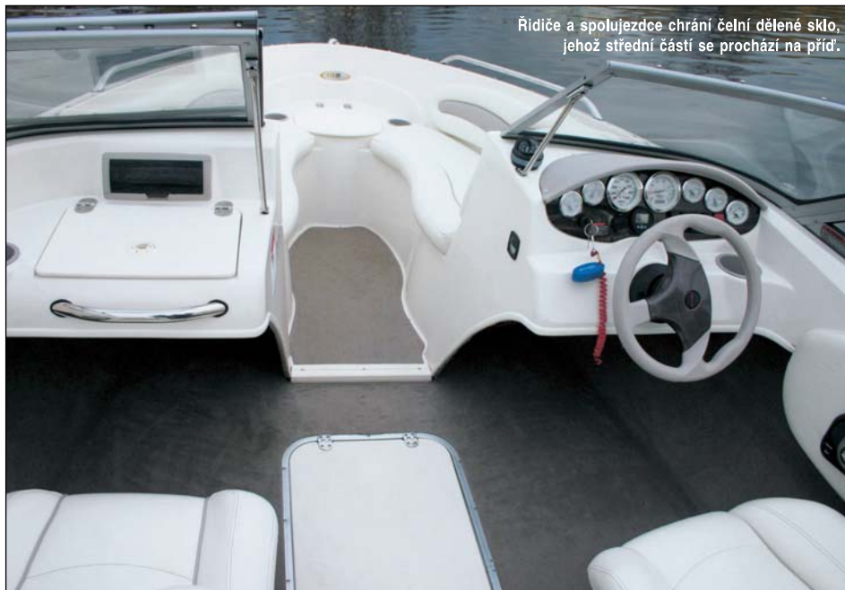
Ridiče a spolujezdce chrání čelní dělené sklo, jehož střední částí se prochází na před.

se dvěma oddělenými sedačkami na zádi. Firma nabízí i verzi LX, která má vzadu velkou plošinu. Navíc jde zadní sedačka zvednout, čímž vznikne velké opalovací plato. Existuje i kajutová verze (cuddy). Patentovaný tvar trupu dává člunu vyšší rychlost než ostatním stejně velkým bowri-derům jiných značek se stejným motorem.