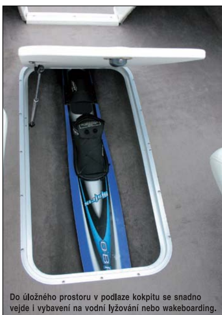
Do úložného prostoru v podlaze kokpitu se snadno vejde i vybavení na vodní lyžování nebo wakeboarding.

Celá loď je kompletně odhlučňená, to znamená, že zád' až na boky je vypěňená a kryt motoru vypořtovaný.