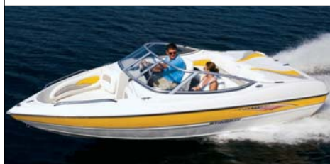
Stingray 185 LS/LX