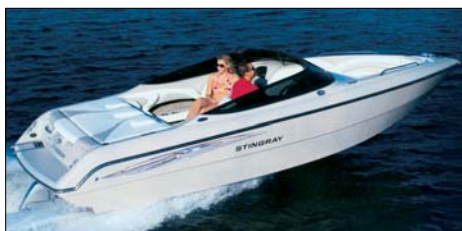
Stingray 220 LX