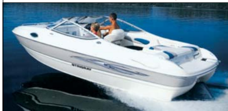
Stingray 210 CS/CX