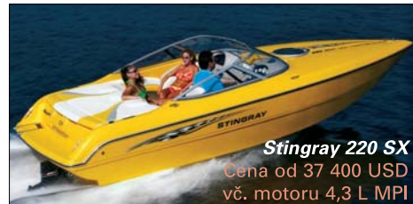
Stingray 220 SX

Prodej a servis lodí, lodních motorů a nafukovacích člunů.