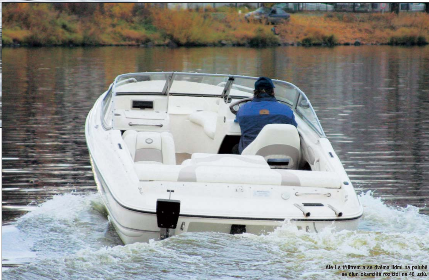
Ale i s třítrem a se dvěma lidmi na palubě se člun okamžitě rozjíždí na 40 uzlů.

Firma má certifikát na montáž motorů značky MerCruiser do svých člunů. Testovaná loď byla vybavena MerCruiserem 3.0, na přání je možné zabudovat i silnější MerCruiser 4.3, dieselový motor nebo také motory značky Volvo Penta. Ale i s třítrem a se dvěma lidmi na palubě se člun okamžitě rozjíždí na 40 uzlů.