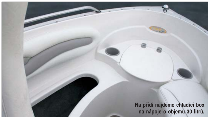
Na přídí najdeme chladič box na nápoje o objemu 30 litrů.