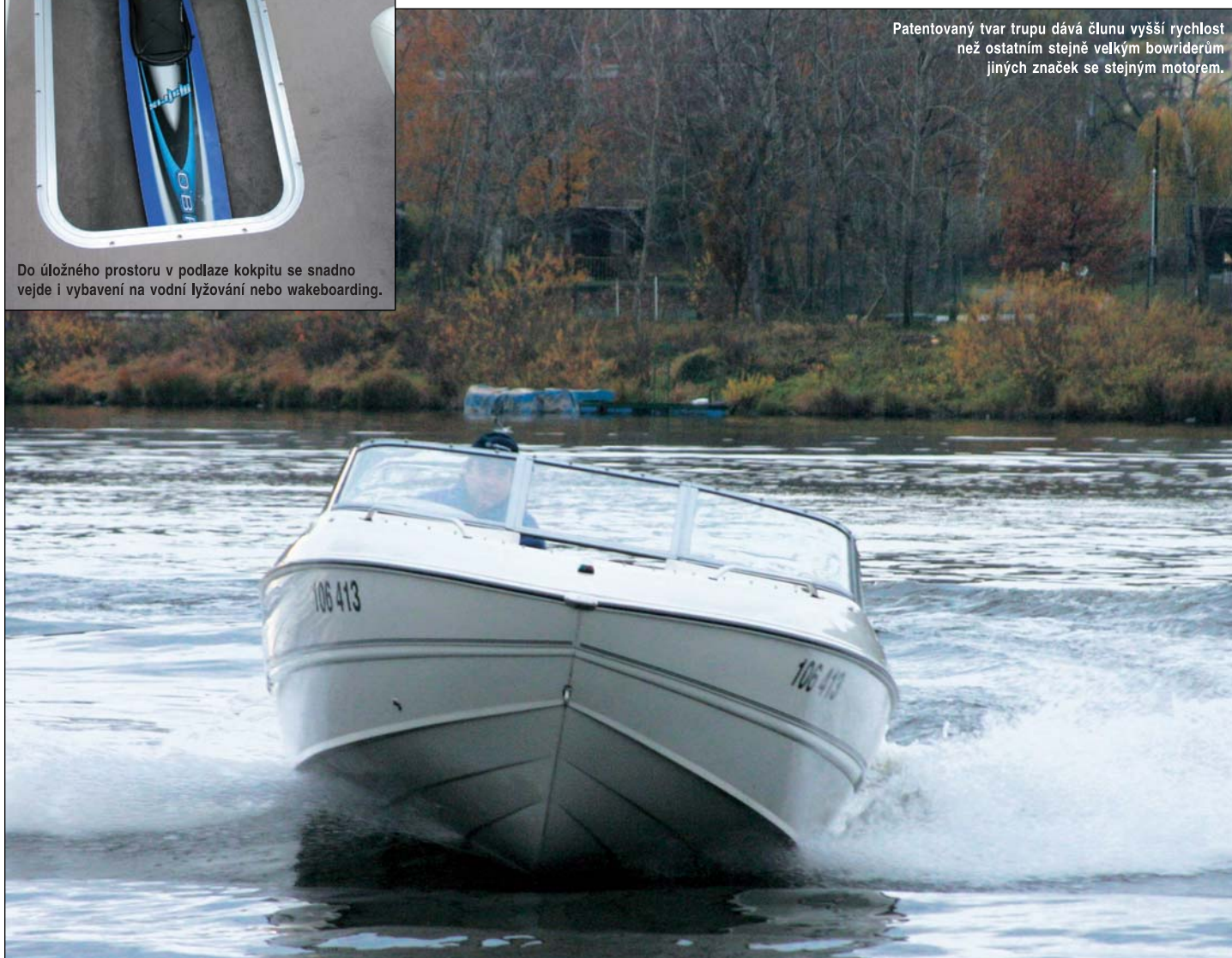
Patentovaný tvar trupu dává člunu vyšší rychlost než ostatním stejně velkým bowriderům jiných značek se stejným motorem.

a přehledná. Ve standardní výbavě je kompletní audio soustava s CD přehrávačem a dálkovým ovládním a velké množství úložných prostor – do toho v podlaze kokpitu se snadno vejde i vybavení na vodní lyžování nebo wakeboarding. Na přídi najdeme chladicí box na nápoje o objemu 30 litrů. Z nadstandardní výbavy byl na testované lodi