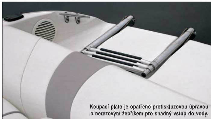
Koupací plato je opatřeno protiskluzovou úpravou a nerezovým žebříkem pro snadný vstup do vody.

pouze hloubkoměr a kompas. Koupací plato je opatřeno protiskluzovou úpravou a nerezovým žebříkem pro snadný vstup do vody. Člun se dá kompletně zakrýt, výrobce nabízí soustavu perseníků.